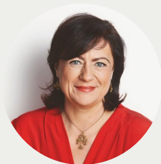
Dr. Bärbel Kofler

Schirmherrin und Mitglied des Vorstands von Aktion gegen den Hunger, Beauftragte der Bundesregierung für Menschenrechtspolitik und Humanitäre Hilfe